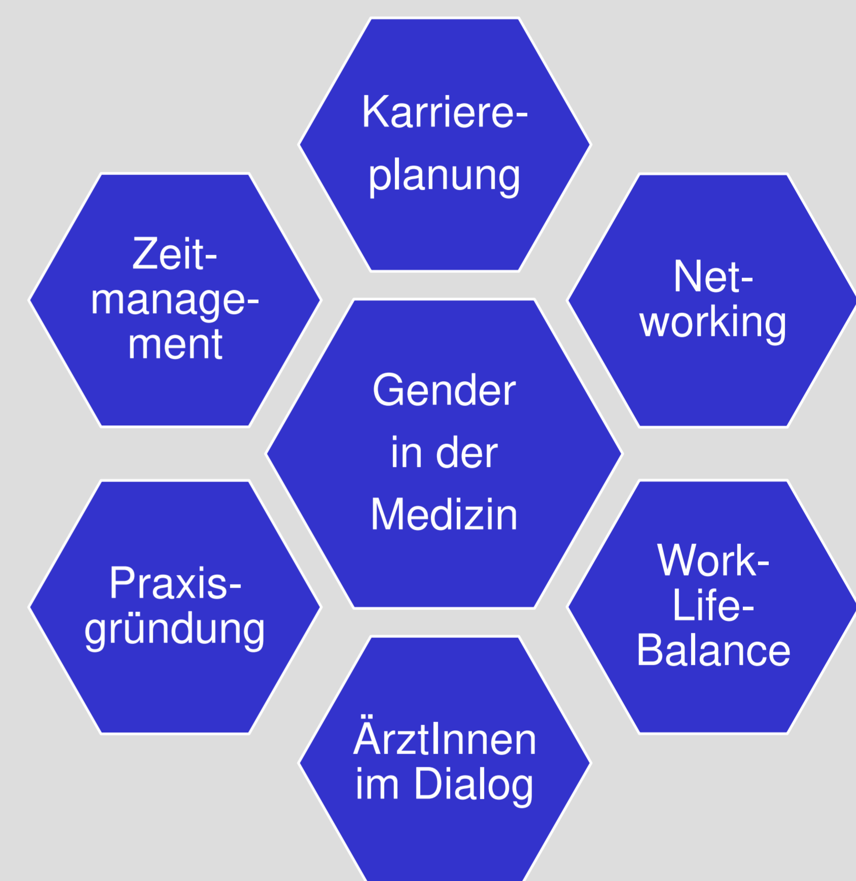
Themenübersicht des Kursangebots „Karriereplanung für Medizinstudentinnen“